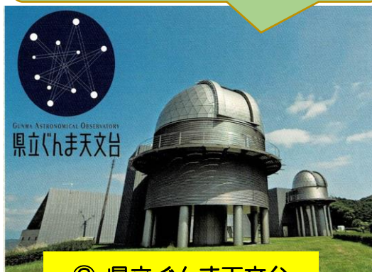
② 県立ぐんま天文台