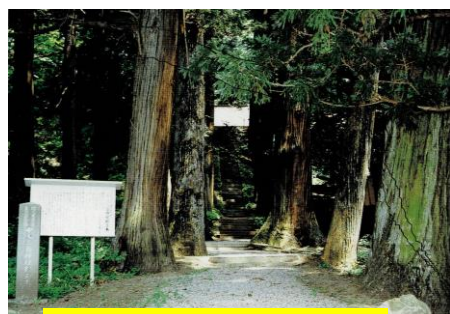
④ 三島神社 杉並木