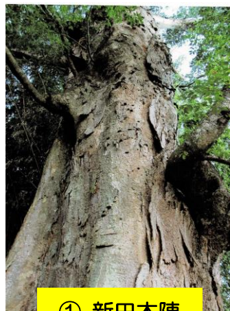
① 新田本陣 大ケヤキ