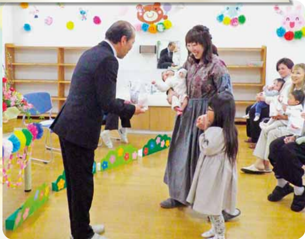
4 / 4 高山村保育所