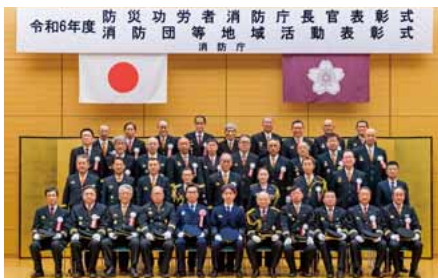
▲消防庁長官および受賞団体等 (令和7年3月5日 総務省消防庁にて)