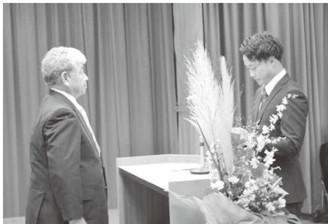
新成人代表あいさつ

新成人となられた皆様、おめでとうございました。心からお祝い申し上げますとともに今後のご活躍を期待いたします。