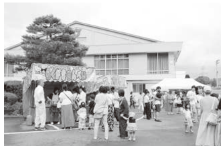
会場外の飲食販売

8月14日(水)第39回高山村ふるさと祭りが開催されました。 今年はいにくの天気となり、会場を村民体育館に移してイベントを行いました。たくさんの皆様にご来場いただきました。