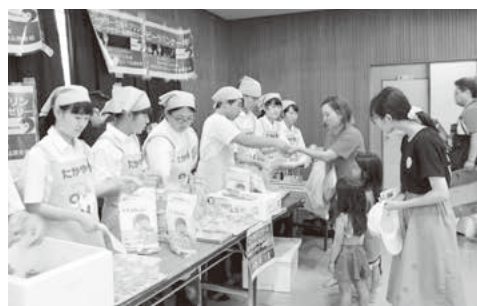
特産品開発コーナーの利根実業高校の生徒達