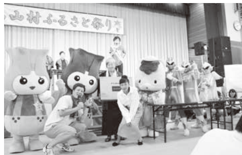
特賞当選者と記念撮影

また、8月17日(土)には、順延されていた花火大会が開催されました。 今回は、花火の打ち上げ場所を変更したため、目の前で楽しめるよう道の駅「中山盆地」に会場を移して行いました。 今回の花火大会にご協賛いただきました皆様、打ち上げにご協力いただいた関係者の皆様に、厚く御礼申し上げます。