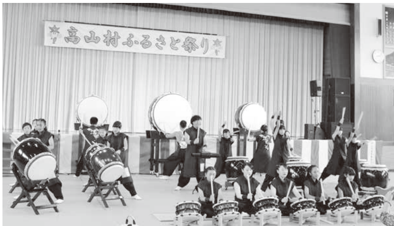
上州高山いぶき太鼓で幕開け！

8月14日(水)第39回高山村ふるさと祭りが開催されました。 今年はいにくの天気となり、会場を村民体育館に移してイベントを行いました。たくさんの皆様にご来場いただきました。