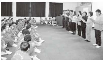
先生方からサプライズで歌のプレゼント