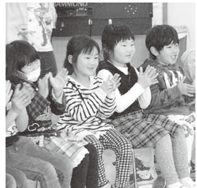
年少の発表を見る年長