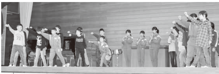
下級生たちからの発表