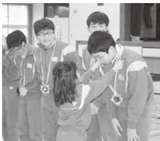
1年生から首かざりのプレゼント