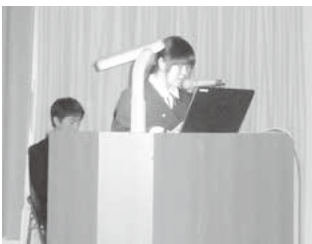
高山中学2年生代表者による「オーストラリアへの海外派遣で学んだこと」の発表