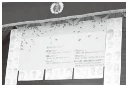
6年生からありがとう!のメッセージ