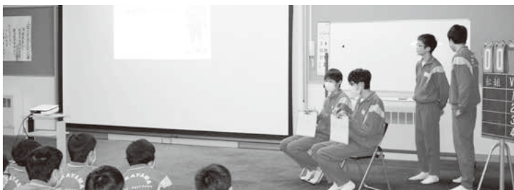
クイズ大会!担任の先生の名前フルネームを漢字で書いてください

御礼に6年生からも発表と手作りの垂れ幕が披露され、下級生のみなさんへの思いが詰まっていて、感動的な送る会でした。