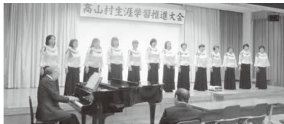
文化協会「りんどうコース部」による合唱