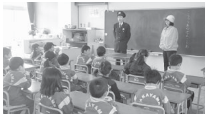
登下校の歩き方等の 指導を受ける新入学生