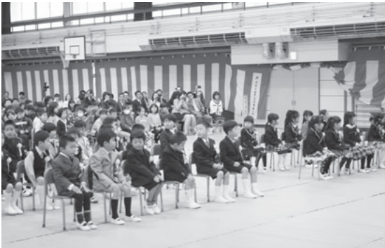
手は膝に…ドキドキ！