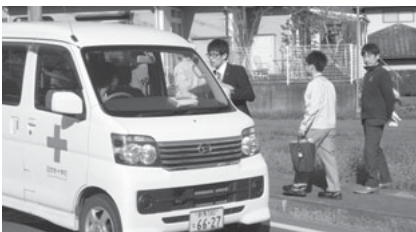
「交通安全運動中です。 気をつけて運転してください。」