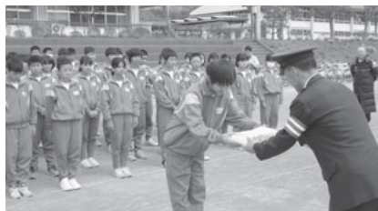
自転車検定後、 反射たすきをもらう新入生徒

運動期間 4月6日(水)～4月15日(金) 吾妻警察署管内でも幼稚園交通安全教室・新入社員等交通安全体験研修会・交通安全キヤンペーン等が行われました。吾妻交通安全協会からは新入児童に黄色の傘・新入生徒に反射たすきが贈呈されました。