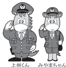
上州くん みやまちゃん

警察相談電話の『全国统一短縮ダイヤル』#9110(シャープ・きゅう・いち・いち・ぜろ)にちなみ、毎年9月11日を『警察相談の日』と定めています。群馬県警察では、県民に親しまれ、信頼される警察を目指して全職員が相談員として相談を受け付けています。警察業務等に関する相談がありましたら、警察安全相談室又は最寄りの警察署、交番・駐在所等にご相談ください。