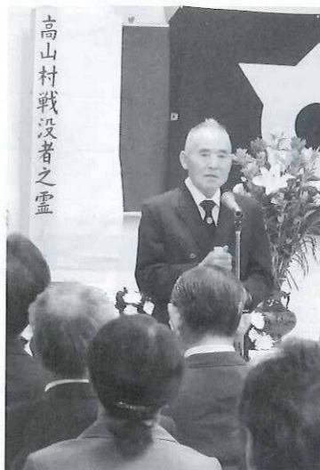
高山村戦没者之霊

去る、9月24日(水)、高山村役場2階大会議室に於いて、社会福祉協議会主催の献花方式による戦没者追悼式に、遺族と来賓や関係者多数の方に参列していただきました。 なお、今年度より慰霊碑を立てしめやかに行われました。