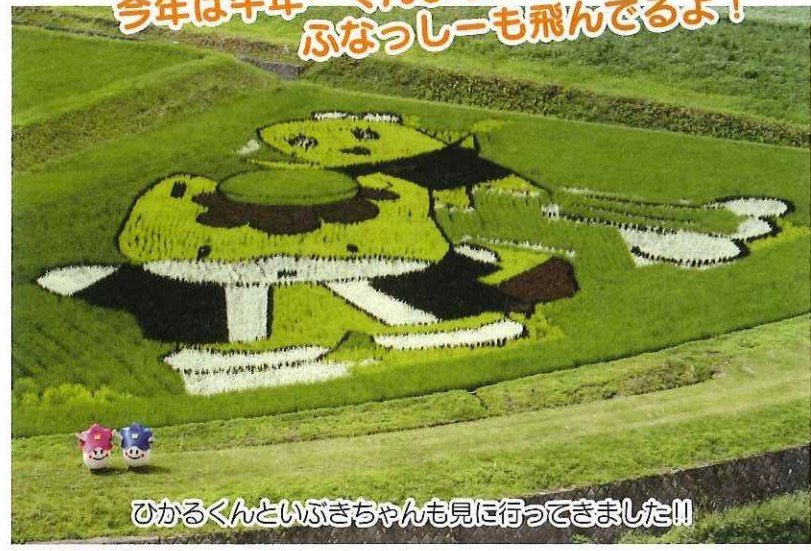
ひかるくんといぶぎちゃんも見に行ってきました!!