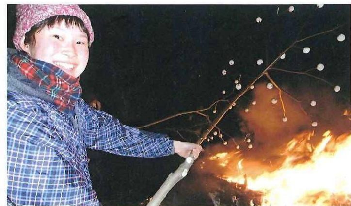
北之谷地区のどんど焼き

私の地元、広島でもどんど焼きと同じような祭りがあり、「どんど焼き」と呼ばれています。みんなで餅を焼いて食べたり、とても楽しかったのを覚えています。やぐら作りを見せていただいた時、自分が小学生のころ、秘密基地を作るのが楽しくてしようがなかったことを思い出しました。