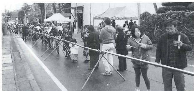
流しそば「早く流れてこないかな」