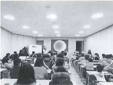
さあ、これから出発です