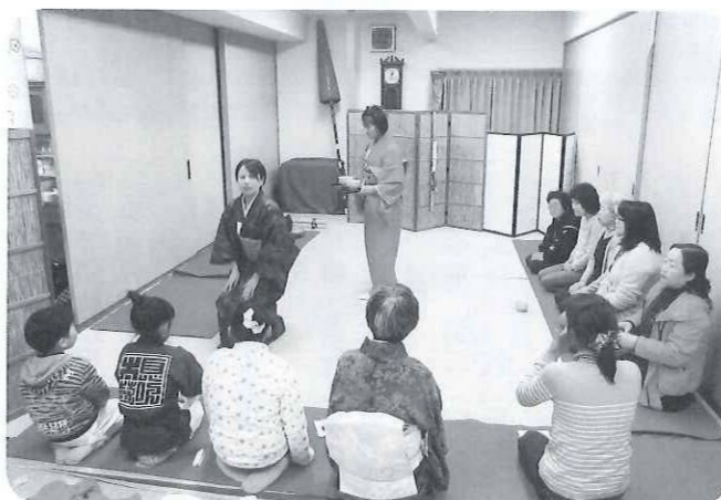
満席のお客さま少々お待ち下さい

販売コーナーでは、ブルーベリージュースや、おまんじゅう、そば、稲荷、みそおでん、コロケ、焼き鳥等、販売前から買い求めるお客さんがいたり、ライスパーラーも長い行列ができ、待ち時間30分以上と売れ行きも上々でした。 無料配布コーナーにおいては、野菜をふんだんに使った手作りの「おつきりこみ」や、「流しそば」「甘酒」、村のブランド米「月あかね」のおにぎりなどなど、村の特産品をはじめいろいろと味わっていただきました。 また、スーパースクイールやわた菓子等の配布には、子どもたちが群がり、体験コーナーでは、わら草履や創作小物を指導してもらいながら熱心につづっている姿や、美味しい和菓子と抹茶を、少し緊張しながら行儀よく待っている姿が見受けられました。