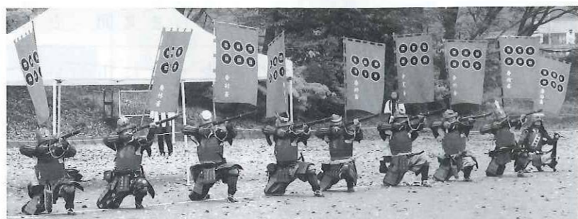
真田鉄砲隊「かまえ〜」の号令で発砲準備