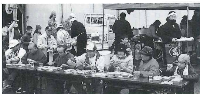
銘柄当てクイズ「どれも美味しいね」