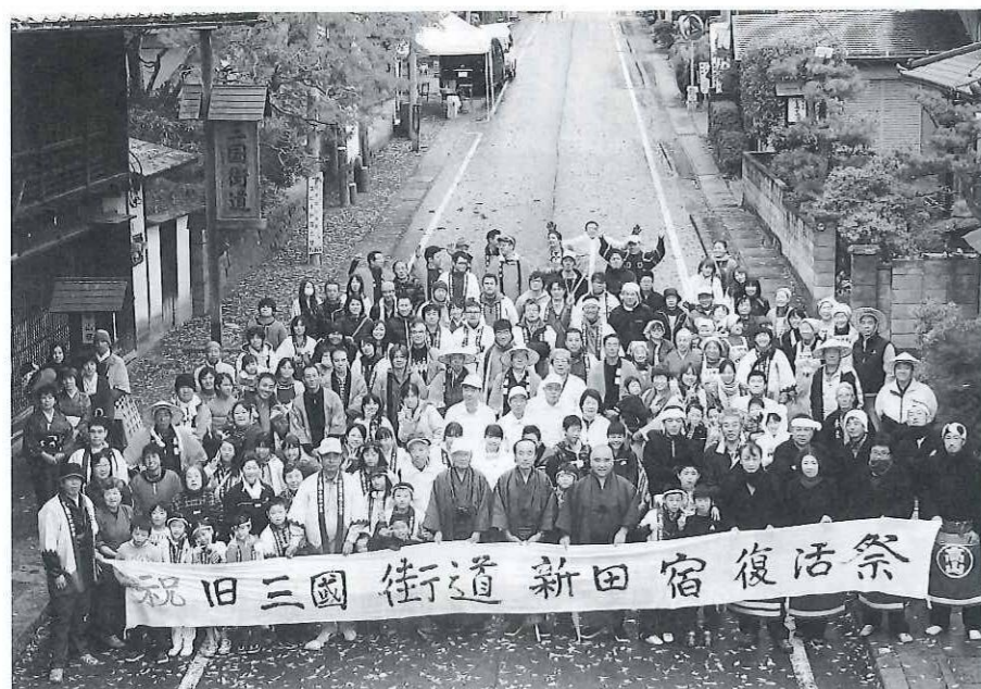
最後にみんなで記念撮影「ご苦労さま〜」

この「第2回新田宿復活祭」を開催するにあたり、たくさんの方にご協力をいただき、思い出に残るイベントができましたことに心より感謝を申し上げます。