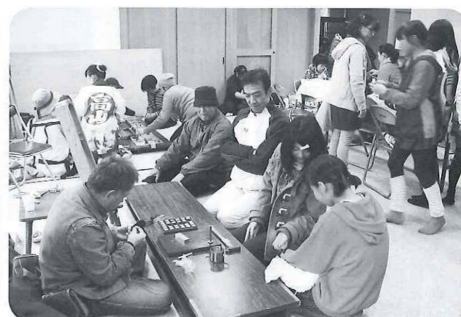
創作小物コーナー