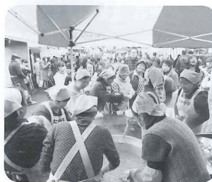
手作りおつきりこみ

販売コーナーでは、ブルーベリージュースや、おまんじゅう、そば、稲荷、みそおでん、コロケ、焼き鳥等、販売前から買い求めるお客さんがいたり、ライスパーラーも長い行列ができ、待ち時間30分以上と売れ行きも上々でした。 無料配布コーナーにおいては、野菜をふんだんに使った手作りの「おつきりこみ」や、「流しそば」「甘酒」、村のブランド米「月あかね」のおにぎりなどなど、村の特産品をはじめいろいろと味わっていただきました。 また、スーパースクイールやわた菓子等の配布には、子どもたちが群がり、体験コーナーでは、わら草履や創作小物を指導してもらいながら熱心につづっている姿や、美味しい和菓子と抹茶を、少し緊張しながら行儀よく待っている姿が見受けられました。