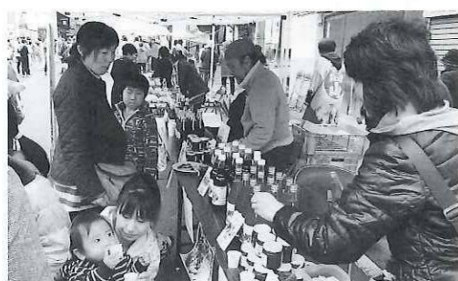
飲食販売コーナー