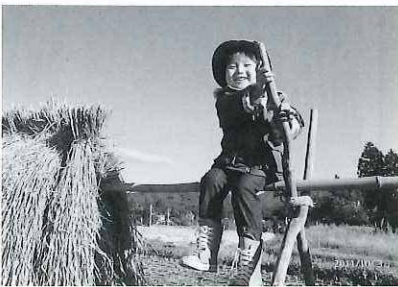
第1回コンテスト最優秀賞「ハンデかけ」

http://www.vill.takeyama.gunma.jp/info/oshirase/photocontest2012.pdf