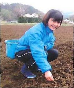
葉草を植える隊員