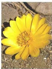
元氣いっぱい咲く福寿草

あとは、村の交流施設「なごみ」に行くのが最近のマイブームです。今まで、存在は知っていたけど行つたことがなくて先日初めて行つたら、あの空間にハマりました(笑) こたつもあつて、ポカポカまゝつたり。おじいちゃんおばあちゃんや、子育て支援センターに来ているお母さんや子どものお喋りも、とても楽しくて、もっと早く行つていたらよかつたなあ。