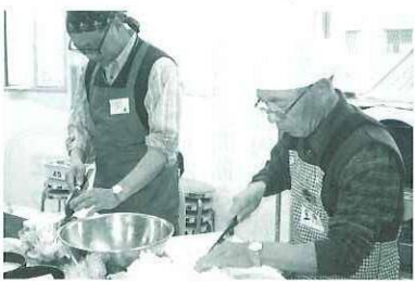
千切りはおまかせ