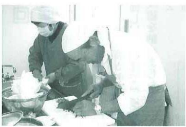
力がはいつてます

参加された方からは、「手作りの餃子は久しぶりなので、とてもおいしかった」「今回は自分の好きな餃子なので是非、家でも作りたい」「奥さんのありがたさがわかったので、感謝して食べようかな」「調理前の準備から参加できて良かった」などの感想をいただきました。 和気あいあいと和やかに教室が実施されました。是非次回もご参加ください。