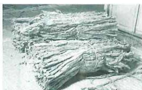
圧さく前の葉タバコ

梱包された葉タバコは、12月6日に葉タバコ農家の皆で長野市の専売公社収納所へ持って行きました。春から始まった葉タバコ栽培もようやく終わりとなりました。