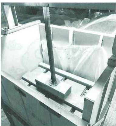
梱包機で圧さく中の葉タバコ