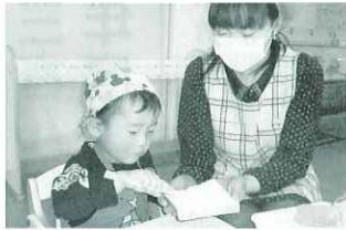
ママと一緒に料理