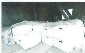
梱包された葉タバコ