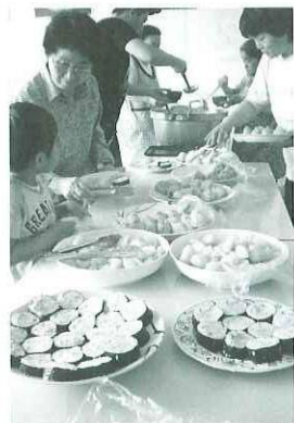
きれいにできました

皆さんとは、お寿司の作り方の話をしたり、食改推の方と偶然同じ学校を卒業した方が昔の話に会話が弾み交流を深めてきました。