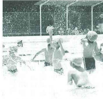
トビウオに変身 (小学校)

小学校では6月21日に、幼稚園では28日にお待ちかねのプール開きが行われました。天候にも恵まれ、強い日差しが降り注ぐ中、冷たい水を浴びてみんな大はしゃぎ。 「きゃー!」「気持ちいい!」とあつちこつちで歓声が聞こえました。今夏も元気に、水と親しんでほしいものです。