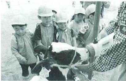
ゴクゴクミルク飲んでるよ