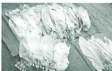
収穫した葉を 麻縄に挟んでいきます