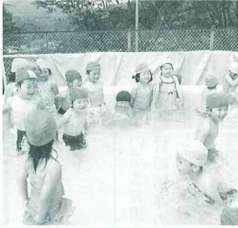
あ〜気持ちいい〜 (幼稚園)