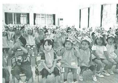
♪お星さま き～らきら♪