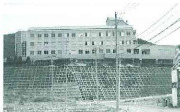
高台に建つ病院の 1階まで津波が押し寄せた

6月20日頃から1回目（下から1〜2枚目の葉）の葉タバコの収穫が行われました。6月下旬に葉タバコの茎の一番上に咲く花に、養分が行かないように花を切り取る作業（芯止め）をし、その2〜3日後に大きく育った葉から横芽が出ないようにする、横芽抑制剤が散布されました。その効果で、小さい横芽が茶色く枯れていました。7月4日には、2回目の収穫（下から3〜4枚目の葉）が行われていました。