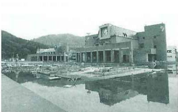
屋上に避難した人が助かった マリナル女川