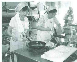
花びらを焼いています