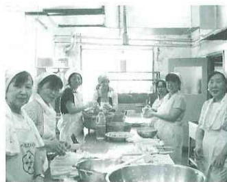
全員でお寿司作り