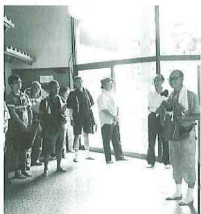
現地研修 (尻高人形)