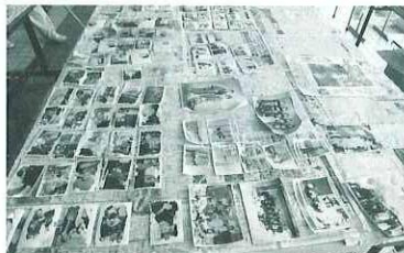
拾得して洗浄した 思い出のつまった写真