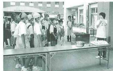
袋を開けなければ3日間、酢を入れれば7日間保存できます!!