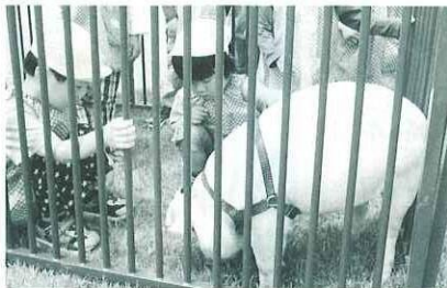
フタさんて、おとなしいんだね

幼稚園で、6月15日に動物ふれあい教室が開催されました。中之条高校の地域との連携授業の一環として、生物生産科動物科学コースの3年生が、動物の生態や飼育方法を教えながら園児と交流しました。園児は、子豚や子牛、うさぎや犬とふれあい、楽しいひとときを過ごしました。