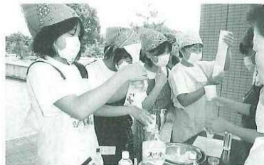
袋の空気を抜くのが難しいな～。