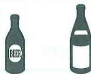
ビールびん 日本酒/焼酎