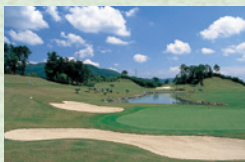
関越ゴルフ倶楽部