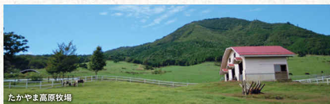
たかやま高原牧場

住所 群馬県吾妻郡高山村大字中山6853 TEL 0279-63-2431 URL https://www.takayama-kanko.jp/midori/