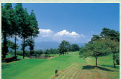
ノーザンカントリークラブ上毛ゴルフ場

3つのゴルフ場があり、都心から90分というアクセスの良さと、季節によっていろいろな表情を見せる自然の中で、思い切りプレーできます。