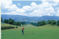
高山ゴルフ倶楽部