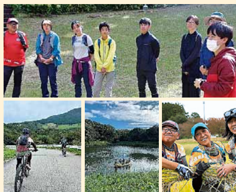
▲R5年度に開催したアドベンチャーレース

屋外でのスポーツイベントなどを通して、村の魅力(里山風景・多様な食べ物)を多くの人へ発信する取り組みをしています。