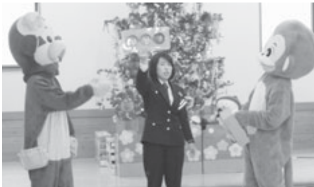
県警本部の交通安全教育隊と お猿のキータン・モモちゃんによる横断歩道の渡り方指導