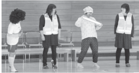
「反射材って大事ななあ～」