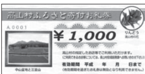
「お礼券(金券)の見本」