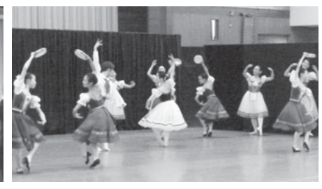
バレエノアコンサート