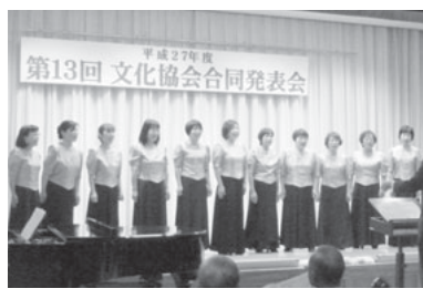
文化協会コーラス部