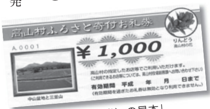
「お礼券（金券）の見本」