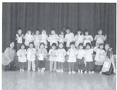
大きくなったね。七五三お祝い♪