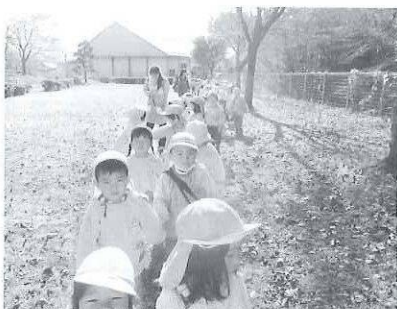
一緒にお散歩楽しいな♪