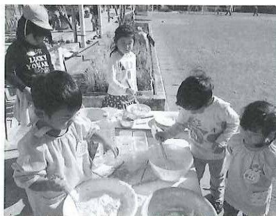
ハロウィーンカボチャで天ぷら作り