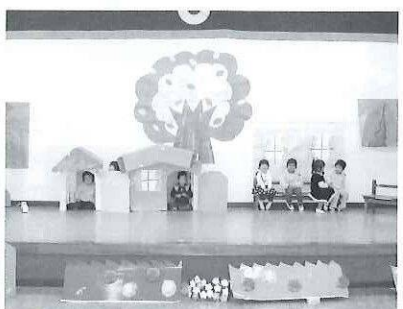
みんなで劇ごっこ！（発表会練習）