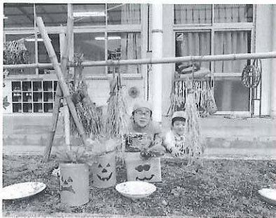
秋の花壇でっこりポーズ♪