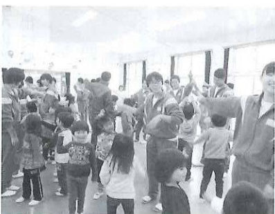
もっと読んで！（中学生保育実習）