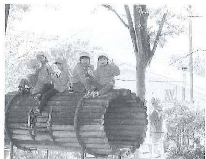
美味しかった焼き芋の会♪