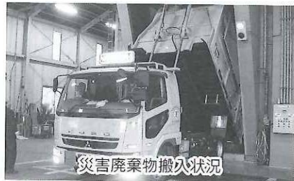
災害廃棄物搬入状況

吾妻東部衛生センターの災害廃棄物の受入結果を報告 受け入れた災害廃棄物のデータ 受入内容 可燃系混合廃棄物（木くず、紙くず、繊維くず、プラスチック等の混合物） 受入期間 平成24年6月8日から平成25年6月7日までの1年間 搬入総量 754・22トン（通常の一般廃棄物の24日分） 搬入台数 181台（1日1台搬入・1回平均4・17トン）