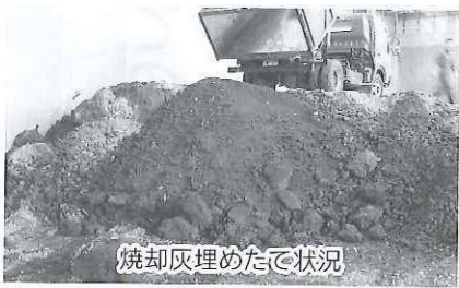
焼却灰埋めたて状況

※放射性物質の測定結果については、ホームページに掲載しています。http://www.agatsumatobuiseisenta.jp/