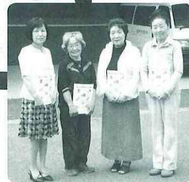
「是非、ご覧ください!!!」