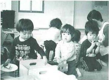
遊びの時間（保育所）