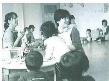
誰か来たかな？「こんにちは〜」

東日本大震災に係る被災市町村人の支援が、5月6日から5月14日まで宮城県女川町で行われました。群馬県からは県職員7名、市町村職員10名、計17名が派遣されました。主な活動内容は、総合案内、自衛隊が収集した拾得物の整理・引き渡し、山積みになっている物資の仕分け、家屋調査支援、支援金等関係資料作成支援、見舞金配布等です。 高山村からも1名の職員が参加しました。その報告によると家屋被害調査で訪問した家庭では、PTSD（心的外傷の後遺症）の子供や、働き盛りの子供を亡くしたお年寄りなどが多く、精神的不安を抱えている方がとても多いようです。離島や中心部から離れた集落は、がれきの撤去場所が確保できず手つかずの状態、被災地は未だに大変な状況のようです。今後も引き続きこの派遣事業は実施されます。