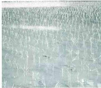
おいしいお米ができますように

5月中旬から、村中で田植えが行われました。田んぼに水が入ると一斉にカエルの鳴き声が勢いよく聞こえてきます。水面には、真つ青な空や白い雲や近くの山が映り、風が吹けばさざ波が立ちます。補植をしていると小さなおたまじやくしも姿を見せ、苗が整然と並ぶ様子も毎年のことですが美しいものです。