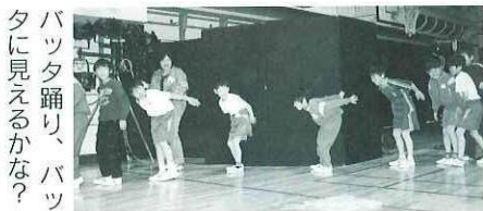
パッタ踊り、パッタに見えるかな?

4月28日、小学校で劇団群馬中芸の皆さんによるアイヌの絵本芝居「パナンペ ペナンペ むかしがたり」が上演されました。善良なパナンペじいさんと粗野で横暴なペナンペじいさんの2人が繰り広げる楽しいお話でした。子ども達は真剣に、時には笑いながらお芝居を鑑賞していました。劇終了後、劇中で演じられたパッタ踊り(パッタキウポポ)と棒遊びの踊り(口ホンナロホン)を皆様はにかみながら楽しんで踊っていました。