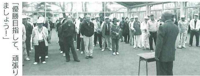
「優勝目指して、頑張りましょう！」