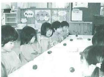
おやつ時間（幼稚園）