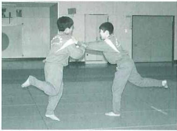
剣道部は、ケンケン相撲で足の瞬発力を

中学校・小学校・幼稚園・保育所に入學（園・所）してから5月10日で約1カ月が経ちました。その後皆さんが学校等で元気に過ごしている様子をちよつとのぞいてみました。