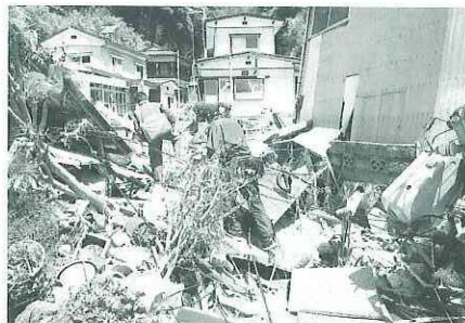
離島で、がれきの上を歩き、奥に残っている家屋の調査