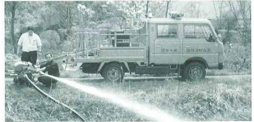
山元町でも、皆を守ってね!!

東日本大震災により岩手県、宮城県、福島県をはじめとする沿岸部の消防団では津波等により多くの消防車両等が破損し、ポンプ車両等の不足が心配されていきました。そこで(財)日本消防協会より提供可能な消防車両等があればこれらを被災された消防団に有効活用できればと連絡がありました。村では廃車予定の消防車が1台あり、これを宮城県亘理郡山元町へ提供することにになりました。提供前に放水試験と点検整備を行いました。