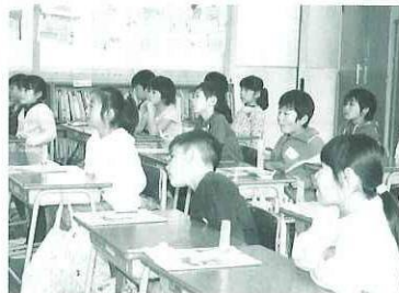
図工の時間（小学校）