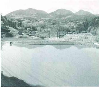
若苗の水面に映る三並山