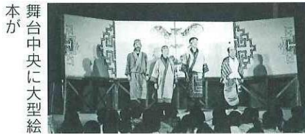
舞台中央に大型絵本が