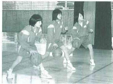
それぞれの部活に入部（中学校）