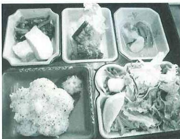
売り出し中のヘルシー弁当

5月3日、スタージェリンで農産物直売所まつりが行われました。新緑のたかやま高原牧場を目の前に、なめこ汁や焼きしいたけの無料配布に、集まった大勢のお客様は「体が温まって美味しいですね」「なめこがでかいね!」と喜んでいただきました。手作りこんにやくで作ったおでんも「市販されているものと全然味が違って美味しい」と大好評でした。販売されていた山菜等も午前中でほぼ完売状態。レストランで売り出し中のヘルシー弁当もかわらず完売でおまつりは大盛況でした。