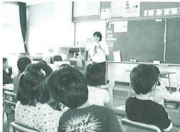
「今日は、折り紙を使ってかざりを作ります！」