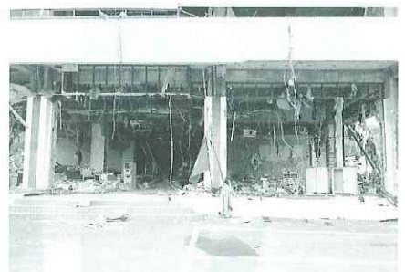
女川町役場庁舎前、復興を誓い中央には、女川町の旗が掲げられている