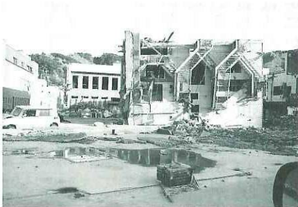
津波で横倒しになったビル