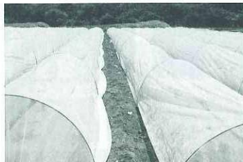
奥までずっと続いています