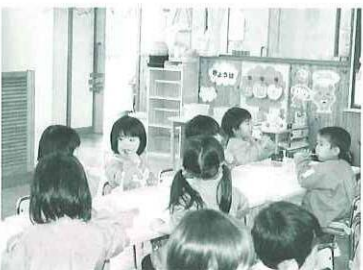
食べた後、はみがきの練習